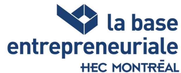
Mono bleu positif